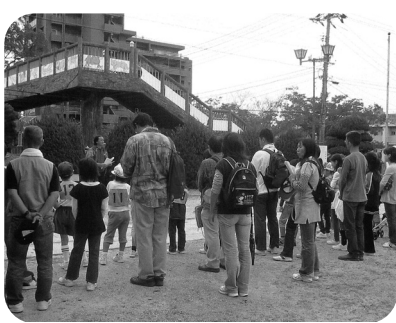
10月 ふるさと史蹟探訪ウォーク