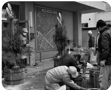
講座生による門松づくり