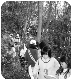
2月 ふるさと史蹟探訪ハイキング