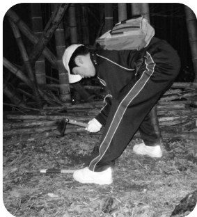
4月 竹の子掘り体験

各事業とも、その都度小中学校を通して募集いたしますが、募集対象や募集人数等に限りがありますのでご了承ください。