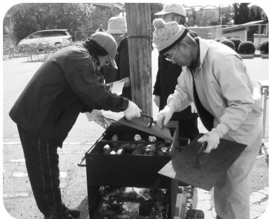
講座生による石焼きいもづくり

婦人学級は婦人会としての活動が多かったが二一年度は学級として定員も20人で活動します。