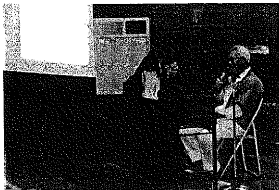
ななはた探訪会の紙芝居