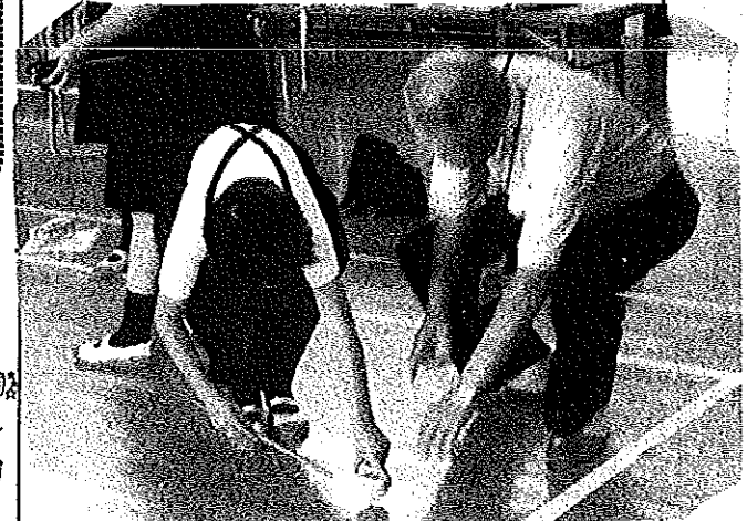
【ぶち独楽(コマ)回しに興ずる子どもたち】

ふれあい参観日 地域の方々、学校運営協議会の方々、児童の祖父母、PTAの方々。全員で22の方々 が参加され、有意義な参観日となったということです。