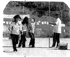
お孫さんの声援 を受けてかっの お嬢さん大奮闘 お孫さん大喜び