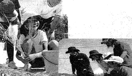
先生たちも一所懸命 池田先生頑張った