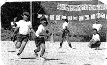
地区赤白百足リレー(地区一般)地区の方々も一所懸命頑張りました 表情がすばらしい 男女別のリレーにも熱が入っていますね