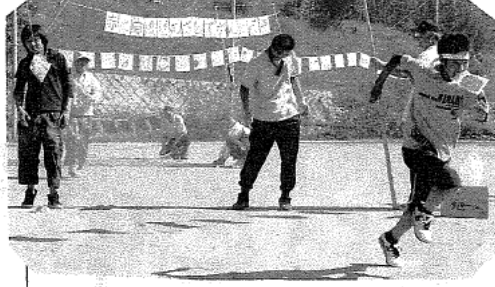
障害物のパン食い競走やはり女性はおし とやか? でしょう!