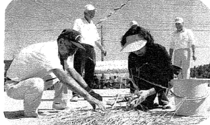
小学生たちも毎年「ふれあい祭り」のしめ縄づくりで上手になって来ました 感謝