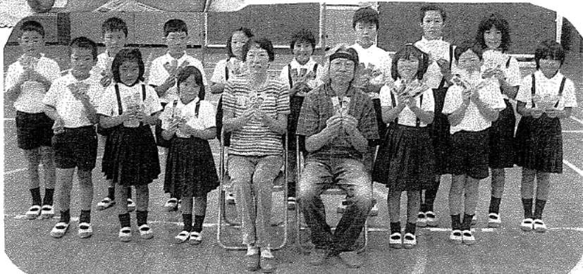
指導者の二人の先生を真ん中に記念撮影。

自然のものを画材にして描いていますが、それぞれの個性?の特徴を子どもたちは、素直に表現することができているそうです。今回は、「葉」形式で描いているとのことでした。子どもたちの中には、4枚も描いている子もいるようです。先生方は、子どもたちの手を捕って丁寧に指導されている様子がよくわかります。