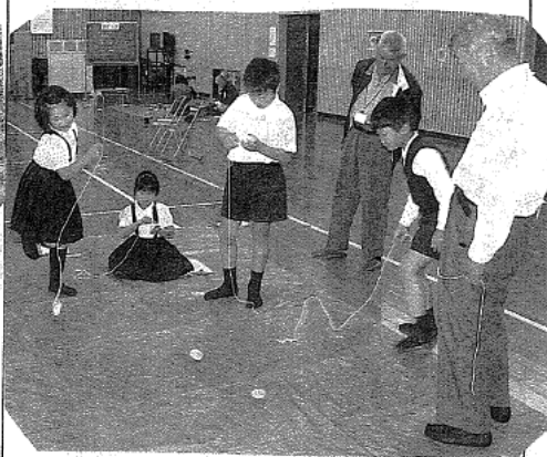
昔遊びのお手玉・四熊カルタも紙玉でっぼうの的当て競技