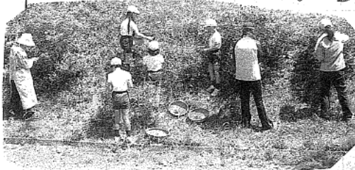
茶摘みした茶葉をほうろくやフライパンで煎(い)って 揉(も)む 準備をしています