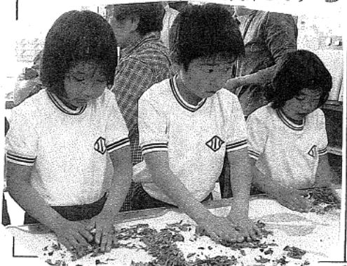
真剣に茶揉みをしています。美味しそう