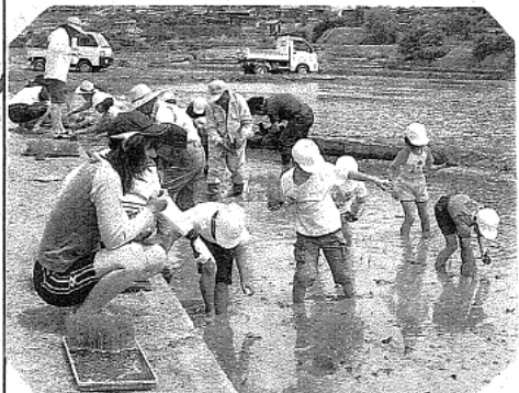
低学年の子どもたちも一所懸命田植えをがんばっていました。