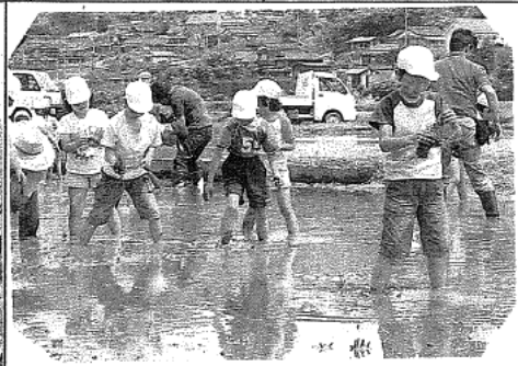
山口朝日放送のカメラマンの方も子どもたちの手元の様子をととても詳しく撮影されていました。中学年の子もたちもとても植え方が手慣れてきました。