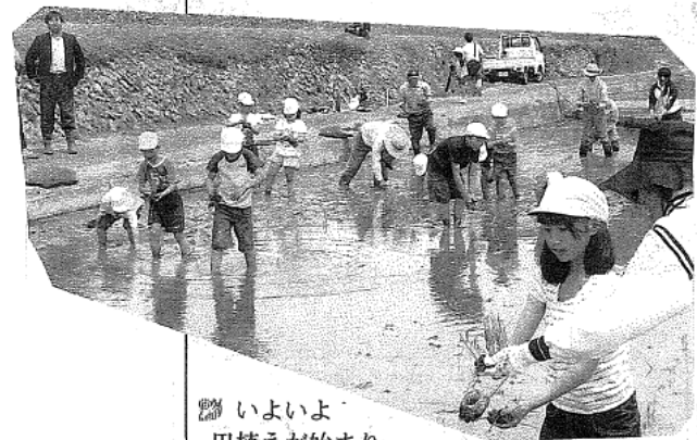
いよいよ田植えが始まりました。高学年は、手慣れたものでとても上手に植えていました。指導助手の方もとても楽しそうでした。田植えをした田んぼは、通学路のすぐ側にありますので、登下校のときに児童は田んぼの苗の育ち方が毎日眺められることをとても喜んでいるそうです