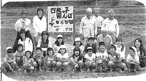
14名のお全児童と先生方。指導者の方々と記念撮影みんなとても満足そうな顔・顔