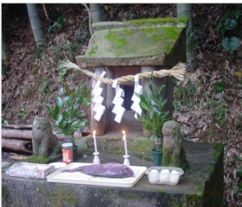
天王様の狛犬(蔵掛)

大典(即位の礼)を地域で祝賀した時の神輿もあつた様だ。祭礼は、毎年 卯 由に部落の人が、祠に注連縄を張り、お供えをします。更に、この神様は、火を好み、暖かくすると喜ぶので、夕方当番の人は、他の部落からも赤々と燃える明かりが判る程 火を焚きます。ご利益は、夏にお祭りする祇園様と同様に、病気に関係し、特に寒い冬に風邪をひかない様に、参詣者を守ってくれる。天王様の狛犬は小さいが、たいへん丁寧な彫りであり、かすかに右側の狛犬に角が生えている獅子だそう。 この天王様を守る神木は、2本の巨木の桜であつたが、昨年1本が倒れてしまった。冬は、風邪をひかない様に祈り、春には、遠くから薄いピンクの雲の様に見える桜を鑑賞し、可愛い小さな狛犬にも会いに行き、その可愛らしさを見て欲しい。