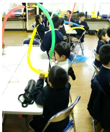
ふうせんアートの様子

まずは勉強の時間のようです。宿題をしたり、読書をしたり、みんな頑張っていますが放課後なので集中が続きません。走り回ってしまつた子の姿も見かけます。これから、宿題をやらないといけないよー(笑)おやつタイムを挟んで、次は体験学習です。毎週まちの先生が何をしたら子供たちが喜ぶだろう、学べるだろうと考えて、企画から準備、指導まで行っています。昨年は花の苗植えやふうせんアート、切り絵、かるた大会などを行いました。