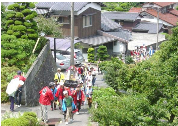
祇園様に向かう神輿

最近向土井の子供会を中心に、夏休みになると、手作りの神輿、「祇園社」の山道を元気に駆け上がり、参詣する「祇園祭」が行われている。元気な姿で、2学期を迎える為に、疫病の厄を払拭してくれる「祇園様」は有難く、身近な存在を感じて、神に感謝している。少子化の時代であるが、地域の伝統行事として、住民の協力で続けて欲しい。