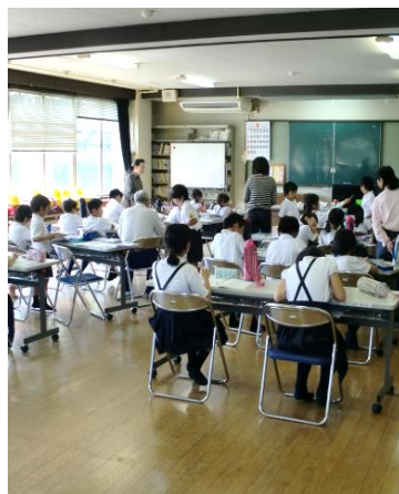
お勉強時間の様子

公民館の玄関です。びっけりしたのは、ワハクラブの子ども達が靴をキレイに揃えているからです。たまたみ低学年の子どもが靴を揃えずにいたり、高学年の子どもが靴を揃えているのところがあつたんです。こうしてお兄ちゃん、お姉ちゃんもこの自覚を育てていきたいと思います。