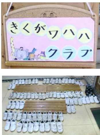
靴がキレイに揃っています！

きくがワハクラブとは放課後子供教室のことで、今年で4年目を迎えます。毎週水曜日に菊川公民館で小学校の児童約40人が勉強や体験学習を通じて、地域や仲間との絆を深める「きくがワハ」を目的に活動しています。名前の由来はワハと楽しく活動する「ワ」そしてきくがわの「わ」とワハの「ワ」は地域の輪を表しています。