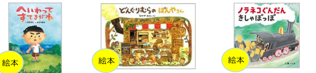
「へいわってすてきだね」 「どんぐりむらのばんやさん」 「ノラネコぐんだんきしゃぼっぼ」