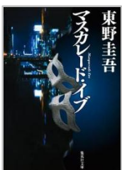
「マスカレードイブ」