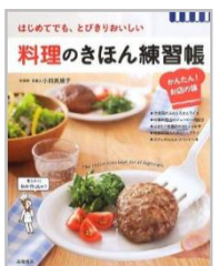
「料理のきほん練習帳」