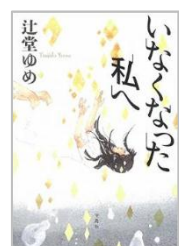
「いなくなった私へ」