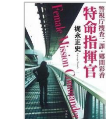
「警視庁二課特命指揮官」