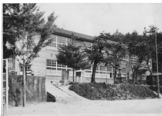
四熊小 現校舎の完成(昭和30年)