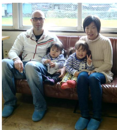
ドワイヤー家のみなさん

昨年第4回の「菊川ふるさとウォーク(小畑)」で、広谷地区の棚田(写真:上)を見て、石垣の素晴らしさに感動した。全国に棚田は多く、夕日に映える棚田や、月が映る棚田を写真で見ると、棚田の魅力はその堅牢な石垣の構成である。気がかされる。冬になると、その石組の魅力が見えて来る。