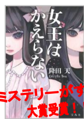
「女王はかえらない」