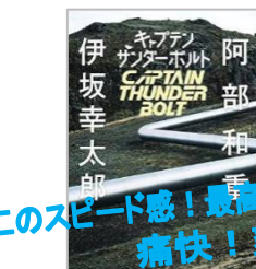
「キャプテンサンダーボルト」