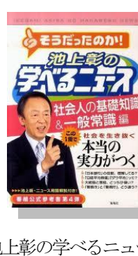
池上彰の学べるニュース 4~6