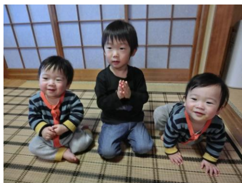
みんなで仲良く元気に育ってね。

かわいい笑顔を集めてみました。掲載可能な写真がありましたら、一言コメントを添えて広報部(菊川公民館内)までご連絡ください。