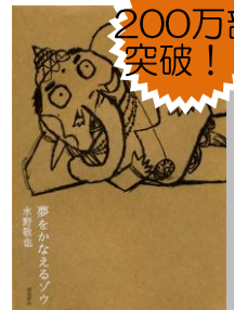
夢をかなえるゾウ 水野敬也