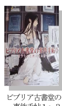
ビブリア古書堂の事件手帖 1~3 三上 延