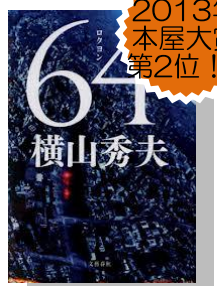
64(ロクヨン) 横山秀夫

山頂付近まで植林がされているが、藪の中から、雑兵が今にも槍でも持つて出て来そうな幽玄さがある。山頂からの眺めは、雑木の間からではあるが、素晴らしい、南野や中山方面をパノラマに見降ろせ、行軍する敵兵もすぐに見付けられる地の利がある城である。その時代の武士の魂を伝える古城が、何時までも、地元の人達を優しく見守っていることに感謝したい。