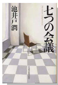
七つの会議 池井戸 潤

D 県史上最悪の未解決事件「64」を描いた警察小説。読み応え十分の著者の自信作。