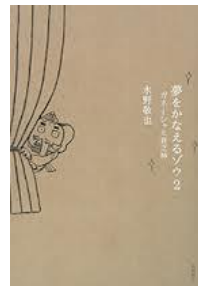
夢をかなえるゾウ2 ガネーシャと貧乏神 水野敬也