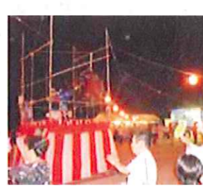
下上夏祭りの様子

夏の風物詩 各地区で夏祭り この季節の風物詩「夏祭り」が各地区で開催されました。8月8日の下上夏まつりを皮切りに13日に四熊地区、14日には小畑地区と加見地区で行われ、各地区とも多くの来場者で賑わいました。