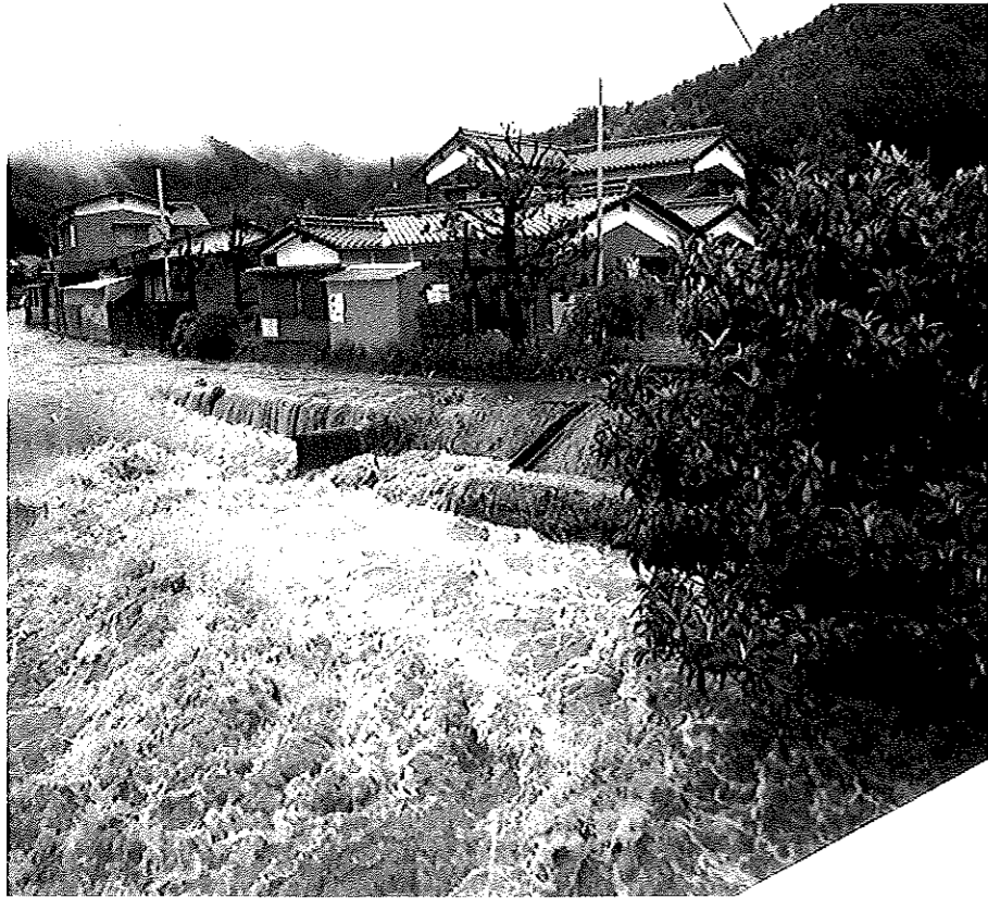
水道橋（菊川浄水場横）から撮影した川曲川

第128号 2009. 9. 1 発行・編集 住みよい菊川をつくる会 菊川公民館 Tel (0834) 62-2801