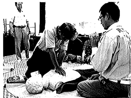
加見自主防災防犯協議会（6/30加見分館）

『AED』って何だろう？無知のまま参加したが消防署の方の説明は大変分かりやすく、AEDの使い方と救命処置の方法を取得できた。もしも家族が倒れた時は救命処置をやってみようという気になった。 119番通報しても救急車が到着するまでに平均6分かかるらしい。 しかし3分以内に救命処置をすることが生存率につながる。呼吸が止まってしまったら、救急車が到着するまで心臓マッサージをすることがとても重要なんだと、心に強く残った。 救命処置が身近に感じられ、大変役立つ講習だった。 加見自主防災防犯協議会（6/30加見分館）