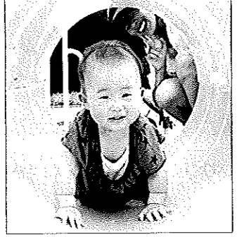
星（せい）ちゃん 11ヶ月 もうすぐ1歳だね！ おめでとう♡