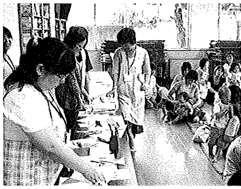
【七夕かざりづくりの準備をする母推さん】