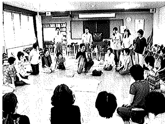
下上地区自主防災防犯協議会（通称しもかみ）（7/8菊川公民館）

豪雨で随所に被害!! 被害を受けられた方に心からお見舞い申し上げます。 7月19日から降り始めた雨は記録的豪雨となりました。川という川が水かさが増し、道路を洗い、田畑に砂や枯れ木が流入するところもありました。また崩土により通行止めとなったり、裏山が滑り軒先まで迫るなど、菊川支所に寄せられた被害届は数十件に及びました。 台風シーズン控え、風や水の猛威から被害を食い止めるためにも、今から備えをしておきましょう。