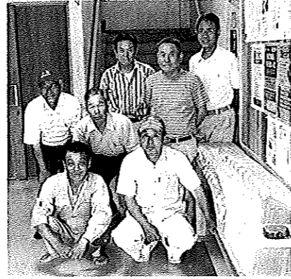
【作った掲示板と棚を菊川公民館に取り付けてもらいました】

懐かしい木造の小畑小学校（休校中）を拠点に、木工が大好きな人たちが集まり、和気あいあいの雰囲気の中で4年目を迎えました。 今までにさまざまな公共施設等の要望に答え、イス、テーブル、ままごとセットのガス台、整理棚など多数作成しています。 クラブ員にとって一番うれしいことは製品を送った方から「重宝しています」などの言葉をいただくことです。 今日も「奉仕の気持ちで楽しもうや」と木工機械の前に立ち、その手の間からは愛らしいウサギの顔や、ハート型の木片が見え隠れしています。