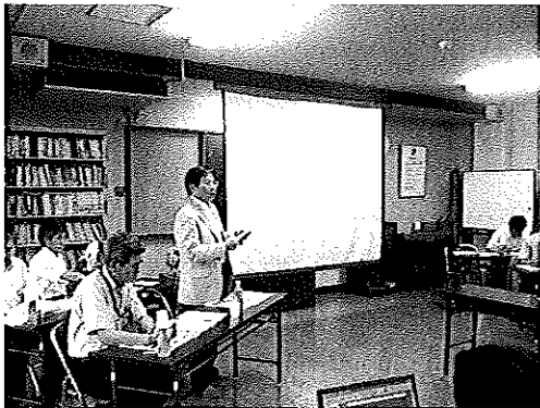
【地区からの数々の質問に答える島津市長】