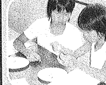
◆主事も挑戦。カンパを思い出します(笑)