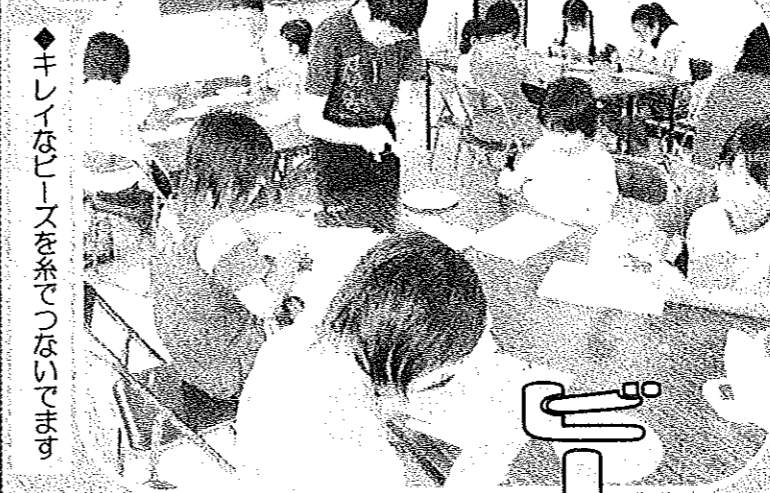
◆キレイなヒースを糸でつないでます