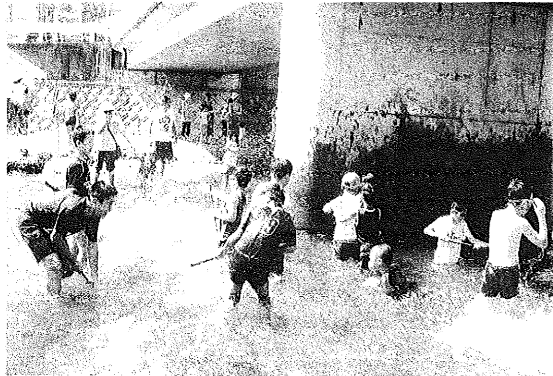
◎川に入って水遊びをする子どもたち。

第 115 号 2006. 9. 1 発行・編集 住みよい菊川をつくる会 菊川公民館 Tel.(0834)62-2801