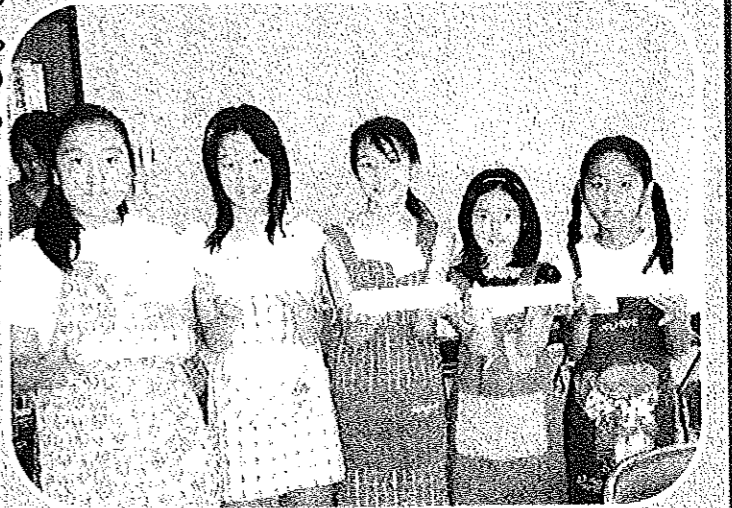
◆作ったネイルチップをもって記念撮影

★ここに掲載した講座に興味がある方は、先生を紹介いたします。菊川公民館(Tel.62-2801)までお問い合わせ下さい。