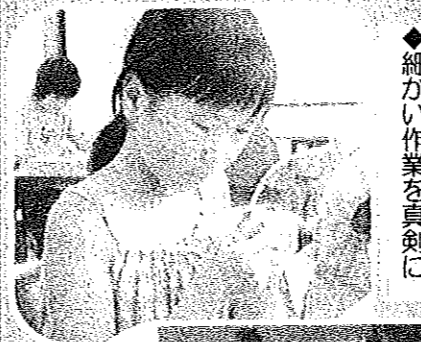
◆細かい作業を真剣に