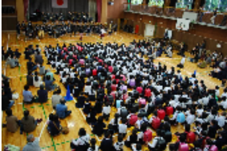
オープニング!熊毛中吹奏楽

※児童たちの声をつづった文集が勝間ふれあいセンターにあります。ぜひご覧ください!※