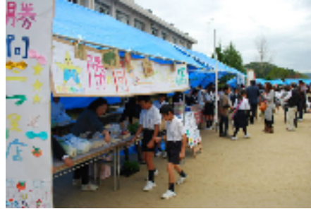
野菜マーケット(5年生)