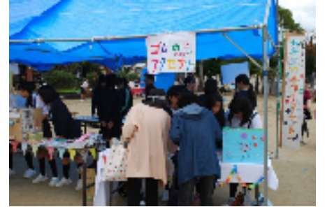
手作りバザー(6年生)