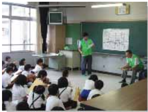
昨年の見守り隊授業のひとつ