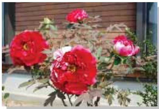
ぼたん／企画広報部員