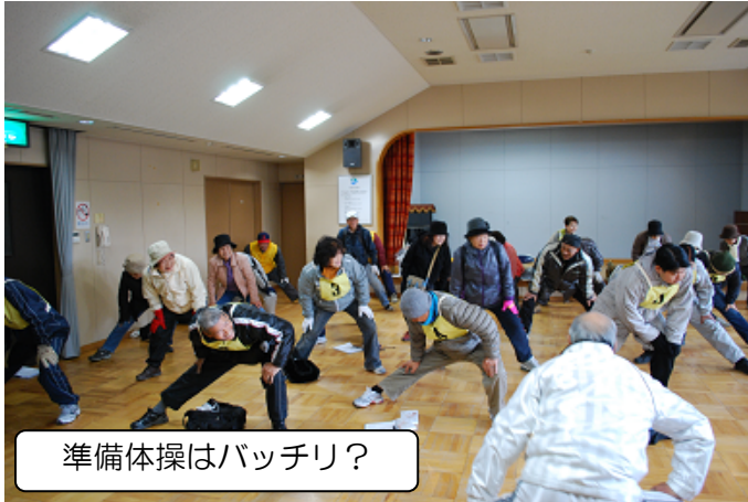
準備体操はバッチリ？