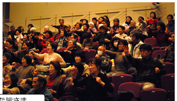
聴講された皆さま