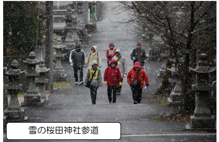
雪の桜田神社参道