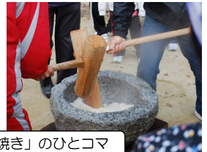
昨年の「大どんど焼き」のひとコマ