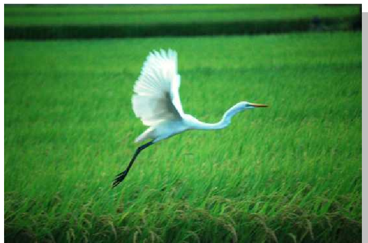
勝間中村川にて/企画広報部員