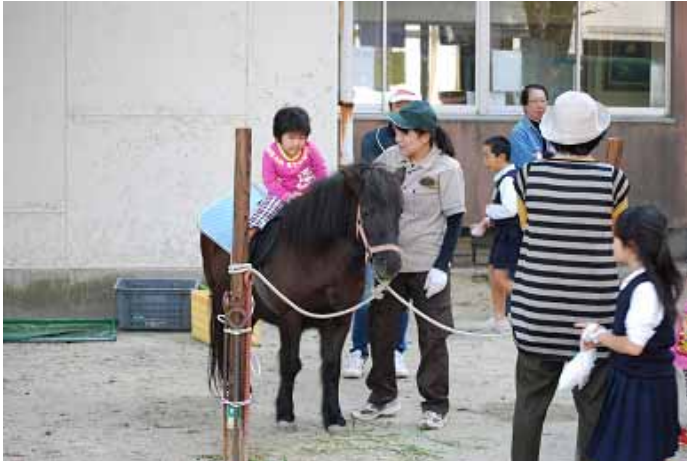
お馬さんに乗ったよ!