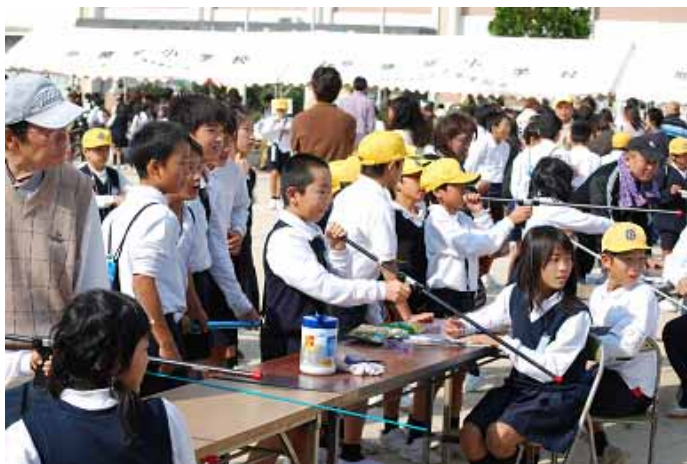
ヒューストン、お手伝いありがとう!