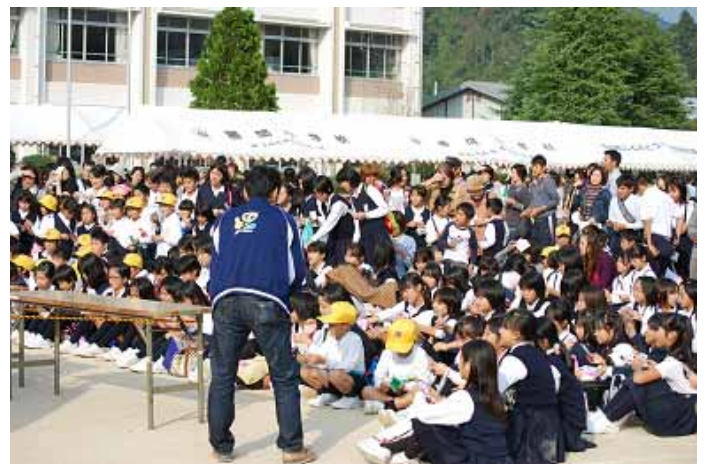
ビンゴ当てるから、撮ってね!