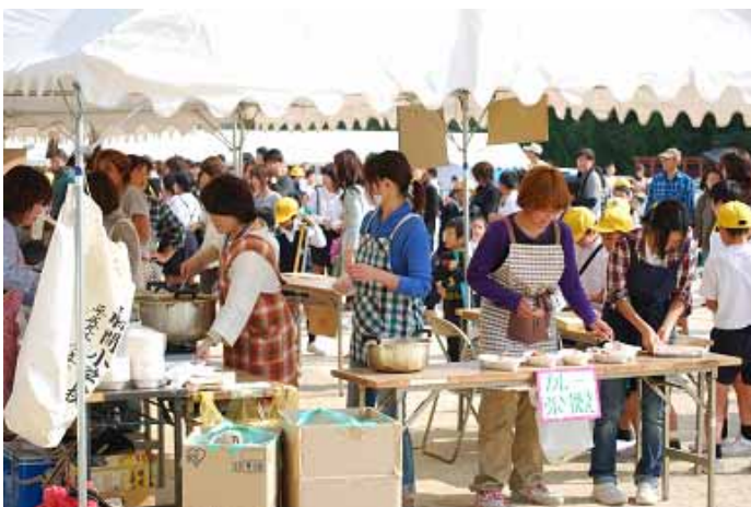
大忙しのバザーの皆さま、お疲れさまでした。