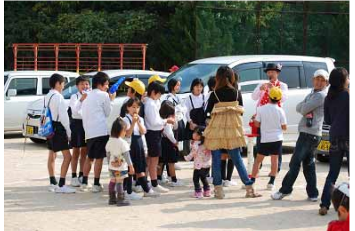
ピエロのマジックバルーン!