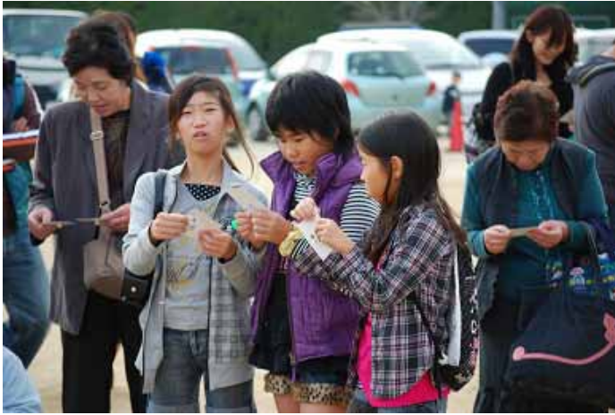
ビンゴ、当たるかなあ？