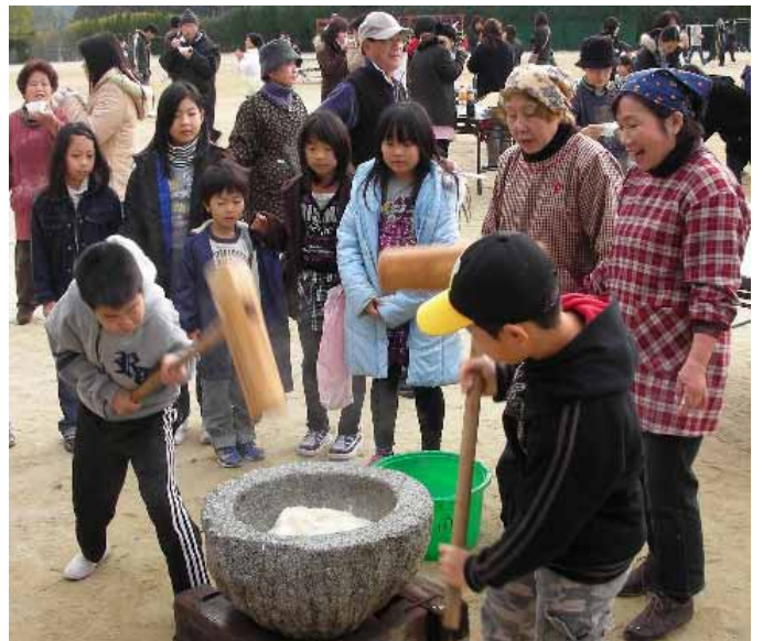
昨年のもちつきの1コマ