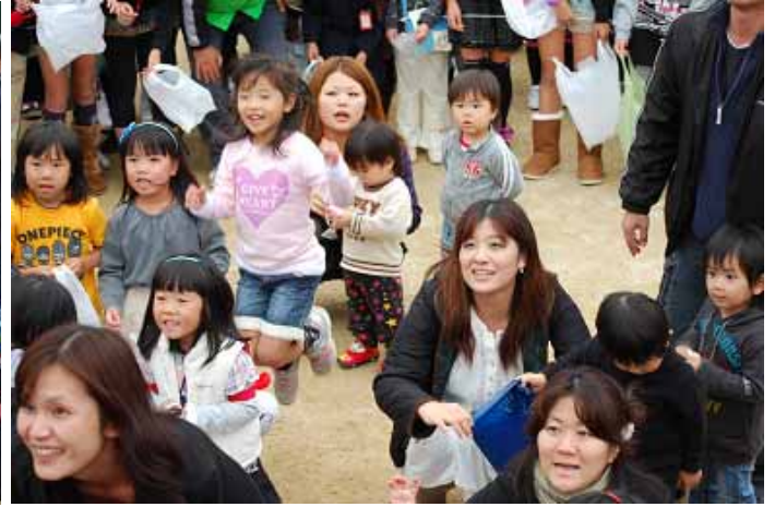
お餅、こっちこっち！