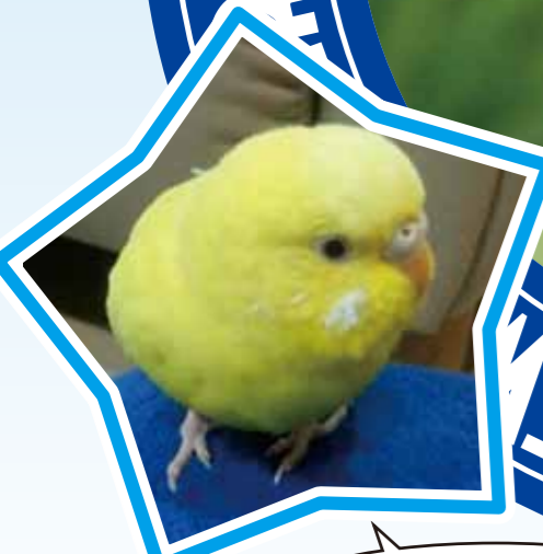
せきせいんこ キイちゃん