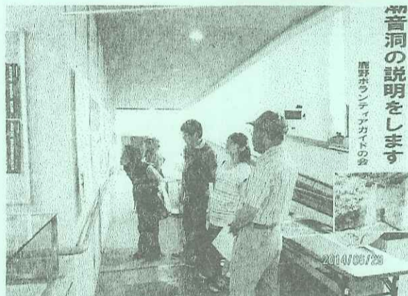
潮音洞の説明をします

ボランティアガイドさんによる潮音洞と鹿野の町割り図の説明のひとコマ。常設してありますので、いつでも見に来てください。