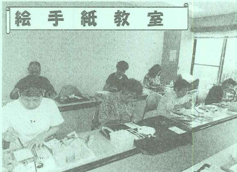
公民館講座のグループ紹介