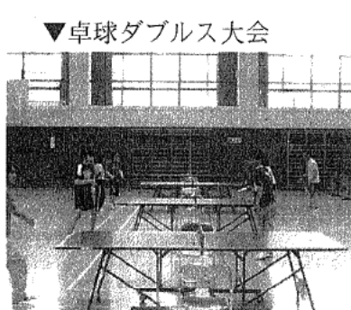
▼卓球ダブルス大会