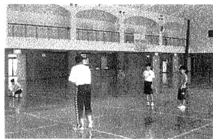
ハンドボール教室の様子