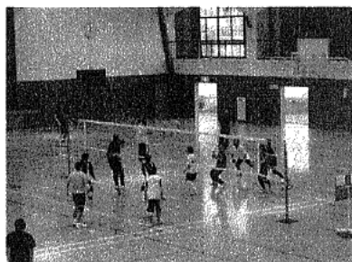
▲バレーボール大会