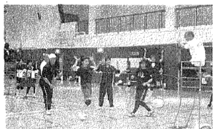
▲ソフトバレーボール大会