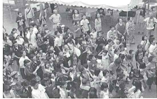
『尚白園祭りフィナーレ・餅まき』 小中学生や園児・先生方や今宿地区住民 の方々が参加されました。(平成27年5月16日)

尚白園 福祉の向上や人権啓発の住民交流の拠点となる開かれたコミュニティセンターとして、生活上の各相談事業や人権課題解決のために、ご案内のような講座や定期的に行う学習会など住民主体の各種事業を総合的に行う。特に本館は、児童館との併設であり、児童の人権意識の高揚をめざし、諸活動の充実を図る。