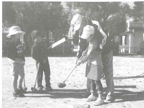
地域とふれあう児童館 (尚白公園でのグランドゴルフ)

尚白園 福祉の向上や人権啓発の住民交流の拠点となる開かれたコミュニティセンターとして、生活上の各相談事業や人権課題解決のために、ご案内のような講座や定期的に行う学習会など住民主体の各種事業を総合的に行う。