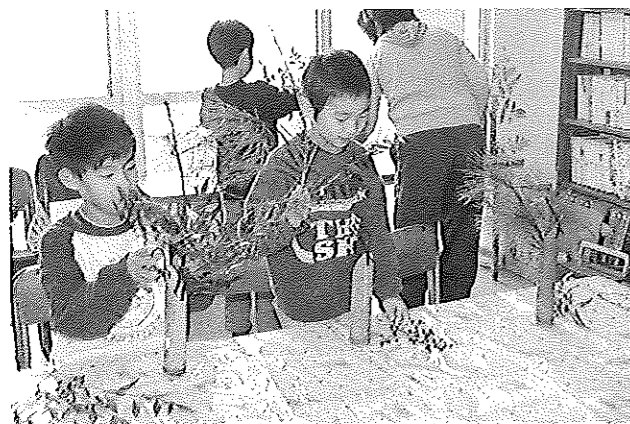
松・竹・梅に南天を添えて正月飾りができました。

尚白園 福祉の向上や人権啓発の住民交流の拠点となる開かれたコミュニティセンターとして、生活上の各種相談事業や人権課題解決のために、ご案内のような講座や定期的に行う学習会などの各種事業を総合的に行う。特に本館は、児童館との併設であり、児童の人権意識の高揚を目指し、諸活動の充実を図る。