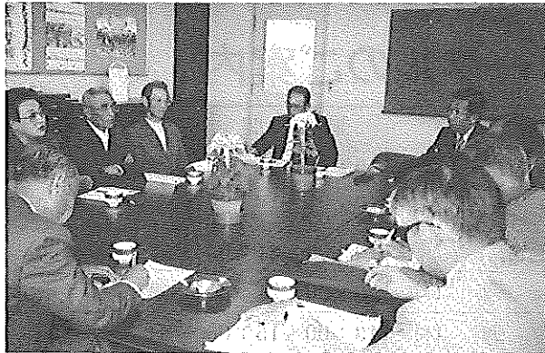
市内中学校長と交流研修（63年度）

児童の日常生活に必要な基本的習慣を養成し、遊びを通じて協調性のある心身ともに健全な児童を育成する。