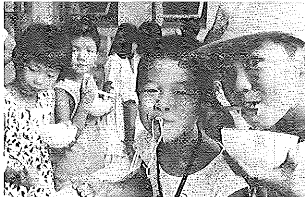
学童のソーメン流し（63年度）

児童の日常生活に必要な基本的習慣を養成し、遊びを通じて協調性のある心身ともに健全な児童を育成する。