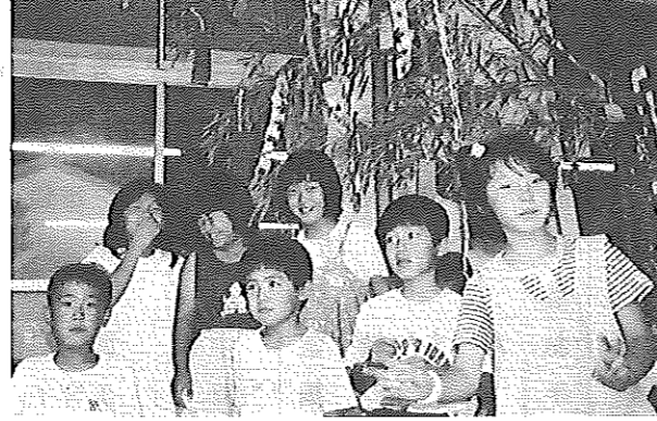
児童の七夕まつり

児童の日常生活に必要な基本的習慣を養成し、遊びを通じて協調性のある心身ともに健全な児童を育成する。