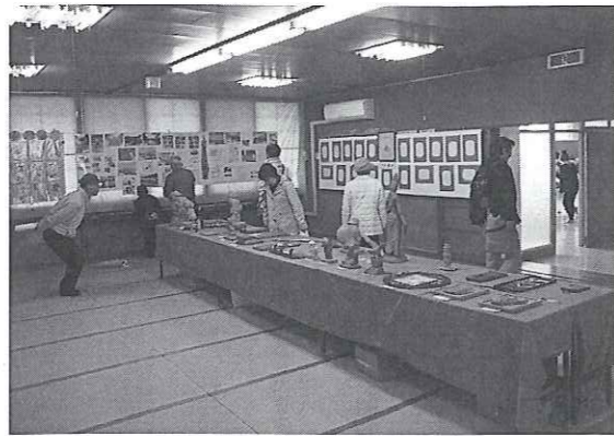
▲講座生の作品展示物

その他にもバザーで昼食、 駐車場でフリーマーケット 飲食物の販売等、 盛りだくさんの内容で お待ちしております。