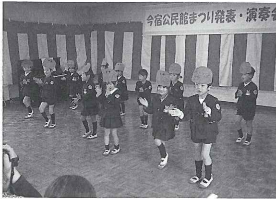
▲▼さまざまな発表企画