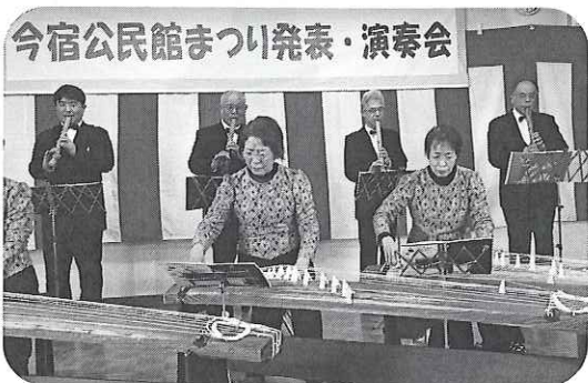
今宿公民館まつり発表・演奏会