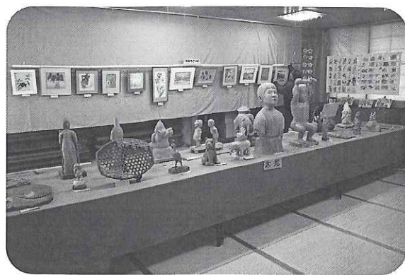
▲講座生の作品展示物