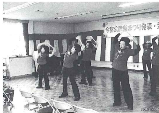
↑ ↓ さまざまな発表企画