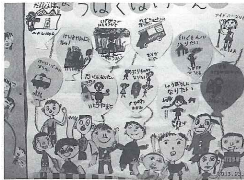
↑ 子ども達や講座生の作品展示物