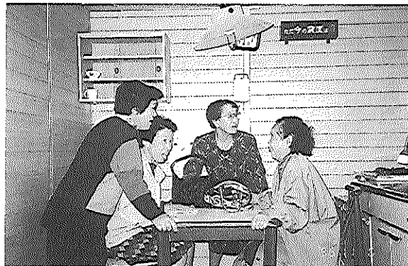
震度7を体験したみなさん

ある防災センターに到着。一行四十五名は早速二階の研修室に案内されて席に着くと「10分お待ち下さい」とのこと。雑談、トイレと時を過ごし、さて講義に入るや「非常口の確認をしましたが？」に始まり、頭ではわかっていても何も実行