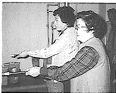
消火器を使つての消火訓練に参加

ある防災センターに到着。一行四十五名は早速二階の研修室に案内されて席に着くと「10分お待ち下さい」とのこと。雑談、トイレと時を過ごし、さて講義に入るや「非常口の確認をしましたが？」に始まり、頭ではわかっていても何も実行