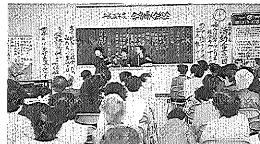
毎年四月に行われる今宿婦人会総会