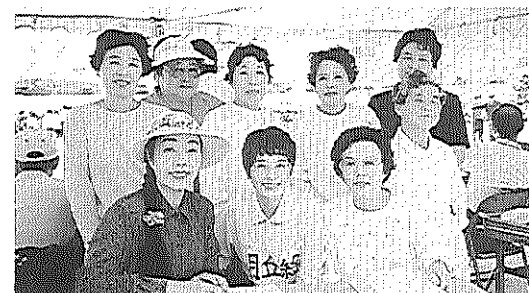
今宿地区の運動会で受付、救護・接待で活躍のみなさん