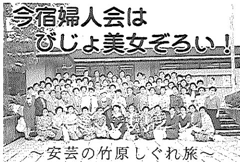
今宿婦人会は びじょ美女ぞろい! ～安芸の竹原しぐれ旅～

現在、困っている一つに、街路樹の下が犬の公衆便所化していることです。どの木の下にも糞が放置され、草取りには手を焼いております。愛大家の皆さん、その都度後始末を是非よろしく。