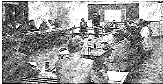
▲市民と刑事を語る会 (今宿公民館にて)