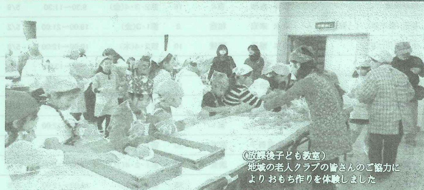
(放課後子ども教室) 地域の老人クラブの皆さんのご協力によりおもち作りを体験しました

秋月地区人口 6,886人 世帯数 2,952世帯 自治会数 13自治会 (平成 26 年 3 月)