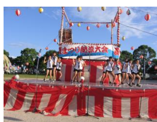
ジュニアヒップダンス