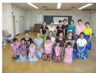
ハワイアン・フラ