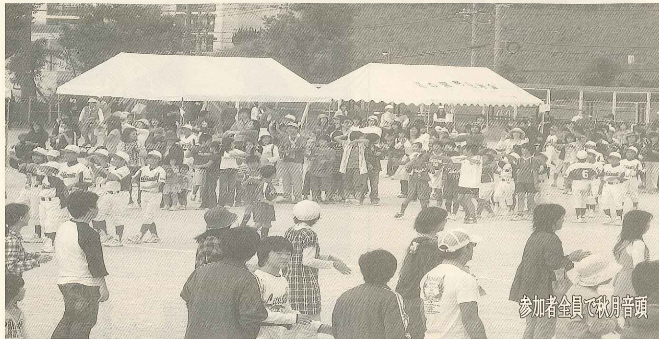
参加者全員で秋月音頭