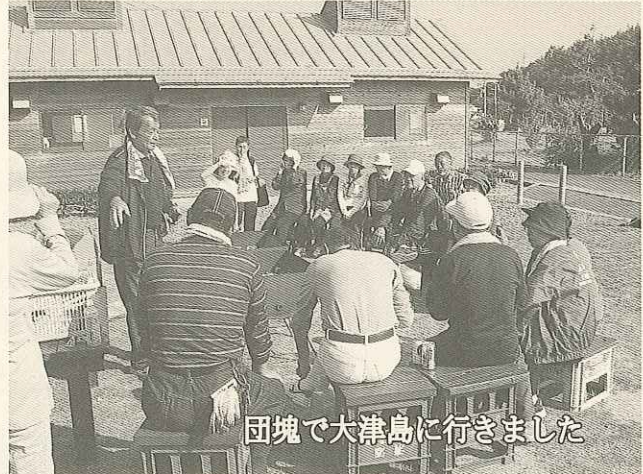
団塊で大津島に行きました