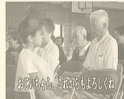
おじいちゃん これからもよろしくね