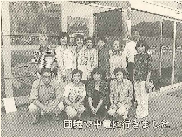
団塊で中電に行きました