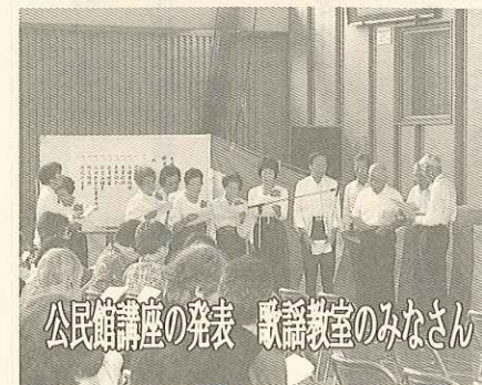
公民館講座の発表 歌謡教室のみなさん