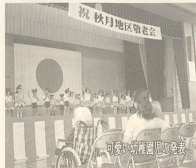
可愛い幼稚園児の発表

秋月地区敬老会が、 9月27日に秋月小学校で行われました。 楠木幼稚園や秋月小学校の可愛い子、ちよっぴりお兄さんお姉さんになった秋月中学校の子たちに囲まれて、また子ども達のブラスバンド演奏等にも、おじいちゃんおばあちゃん達はとても喜んでいました。 その他に、秋月公民館で行われている講座生の方達の出し物もありました。 みなさん、これからもお元気で、また来年来てくださいね。 来年はもっともっと楽しい内容を考えます。