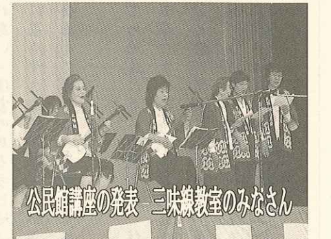
公民館講座の発表 三味線教室のみなさん