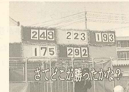
さてどこが勝ったかな?

※茶色(秋月ニュータウン・秋月3丁目)が優勝、続いて青色(曙町・黒岩町・サンシャインヒルズ)、桃色(扇町県営住宅・扇町市営住宅)、緑色(江の宮町・江の宮12棟)、黄色(秋月1丁目・秋月2丁目・楠木2丁目)の順でした。点数は写真の通りです。