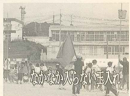
なかなか入らない玉入れ