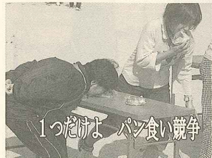
1っだけよ パン食い競争