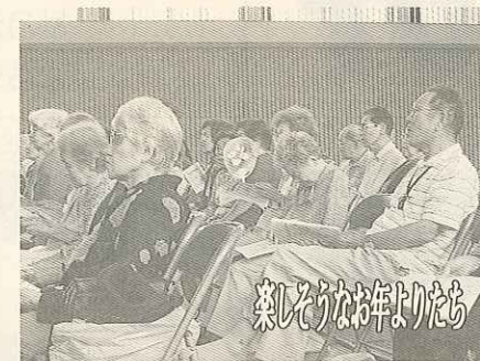
楽しそうなお年よりたち