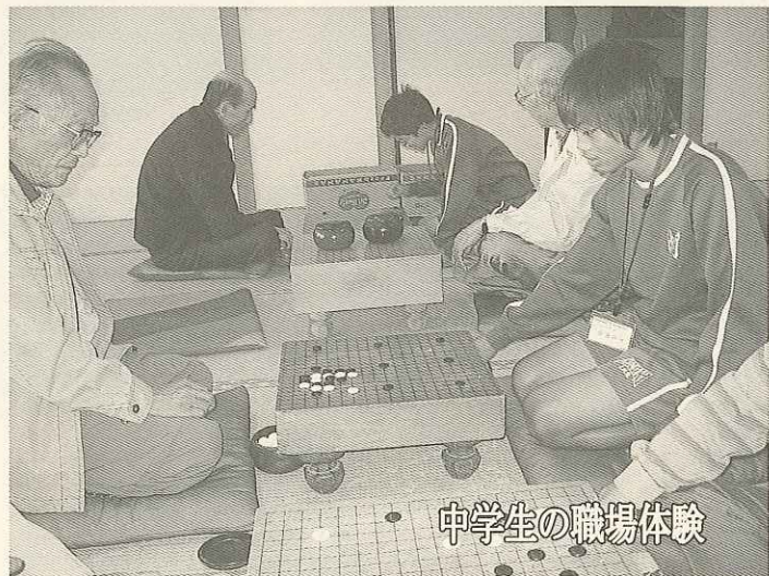
中学生の職場体験