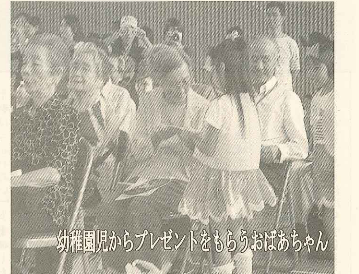
幼稚園児からプレゼントをもらうおばあちゃん