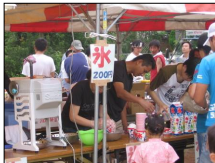
かき氷・・・秋月郵便局