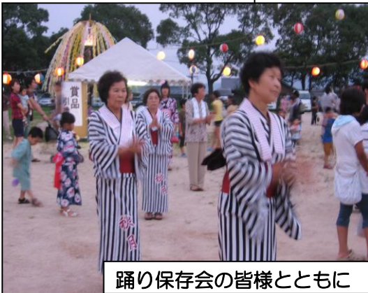
踊り保存会の皆様とともに

子ども太鼓のバチさばきは実にうまく、3日間だけの練習とは思えませんでした。踊り保存会の方々の先導で「秋月音頭」や「さんさ踊り」も大いに賑わいました。