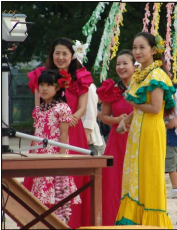
ハワイアンフラ待ち時間

8月1日(土)、秋月公園で地区の夏祭りが行われました。今年は「スイカ早食い競争」や「仮装大会」の新しい企画もあり、舞台は大いに盛り上がっていました。2年ぶりの祭りでしたが、子ども達にも楽しい思い出ができました。役員の皆様、事前の準備から夜遅くの後始末まで、本当に本当にお疲れ様でした。