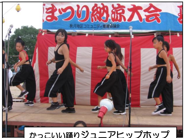
カッコいい踊りジュニアヒップホップ

8月1日(土)、秋月公園で地区の夏祭りが行われました。今年は「スイカ早食い競争」や「仮装大会」の新しい企画もあり、舞台は大いに盛り上がっていました。2年ぶりの祭りでしたが、子ども達にも楽しい思い出ができました。役員の皆様、事前の準備から夜遅くの後始末まで、本当に本当にお疲れ様でした。