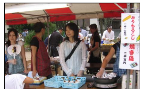
とうもろこし・焼き鳥・秋月サッカー