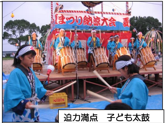
迫力満点 子ども太鼓

子ども太鼓のバチさばきは実にうまく、3日間だけの練習とは思えませんでした。踊り保存会の方々の先導で「秋月音頭」や「さんさ踊り」も大いに賑わいました。