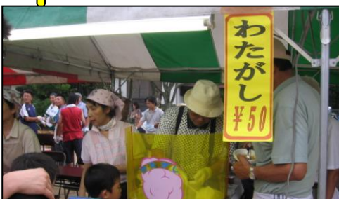
団塊カレー・わた菓子販売 団塊「生き方塾」