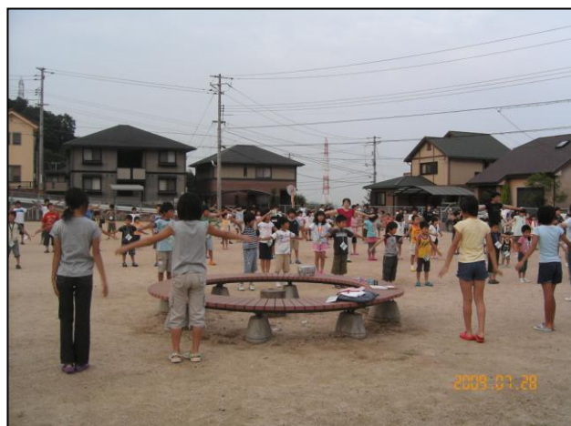
秋月ニュータウン1号公園にて