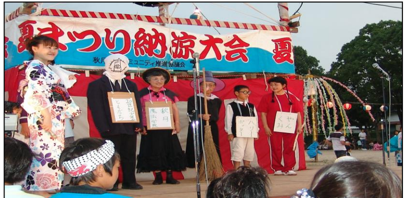
仮装大会・・・何に変装したか・・・わかるかな