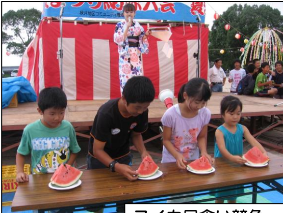
スイカ早食い競争