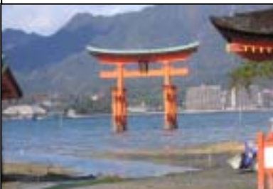
潮がひいた時の厳島神社鳥居

秋月「生き方塾」では11月18日(火)旅行班企画の宮島紅葉狩りに出かけました。風が強く少し肌寒い日でしたが、見事な紅葉ぶりや、毅然と立ち並ぶ厳島神社の壮観な眺めに心が洗われる一日でした。とりわけ、68歳のベテランガイドさんの名ガイドぶりに、お腹の皮が破れてしまいそう・・・笑いの連続で、ふれあい多いとっても楽しい旅行でした。歩け歩け班も、西公園から遠石へ出るコースを1時間少しで歩いてみました。うどんづくり班も今までの料理教室の方と交代して、「団塊うどん」づくりに挑戦します。団塊世代の地域参画にますます拍車がかかっているこの頃です。