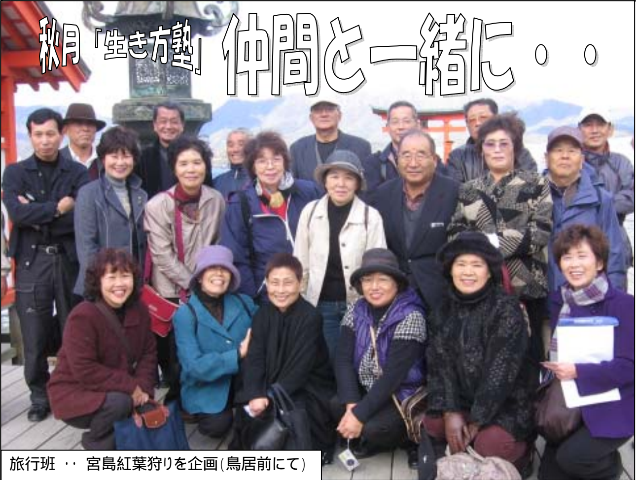
旅行班 ・ 宮島紅葉狩りを企画(鳥居前にて)