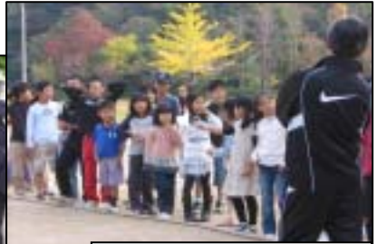
×クイズに神妙に取り組む子ども達