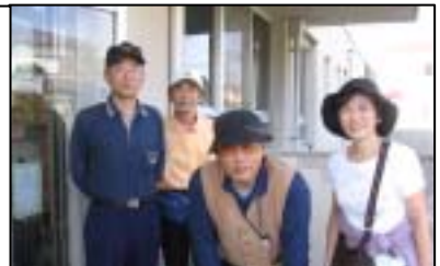
歩いた後の爽快な気分です！

秋月「生き方塾」では11月18日(火)旅行班企画の宮島紅葉狩りに出かけました。風が強く少し肌寒い日でしたが、見事な紅葉ぶりや、毅然と立ち並ぶ厳島神社の壮観な眺めに心が洗われる一日でした。とりわけ、68歳のベテランガイドさんの名ガイドぶりに、お腹の皮が破れてしまいそう・・・笑いの連続で、ふれあい多いとっても楽しい旅行でした。歩け歩け班も、西公園から遠石へ出るコースを1時間少しで歩いてみました。うどんづくり班も今までの料理教室の方と交代して、「団塊うどん」づくりに挑戦します。団塊世代の地域参画にますます拍車がかかっているこの頃です。