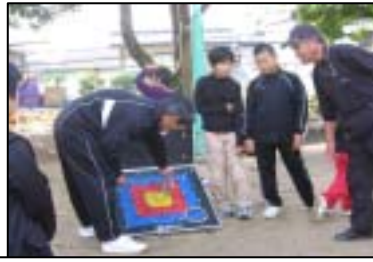
輪投げのこつをわかりやすく指導

11月16日(日) 秋月公園でレクリエーション大会がありました。輪投げやドッチボール・×クイズや餅まきなど、子ども達は大喜び。役員の方が子ども達の健全育成に地道に取り組んでおられる姿に心から感動しました。(秋月体育振興会主催)