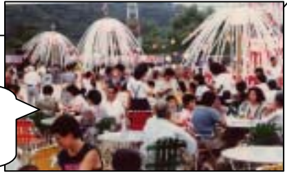
柳灯籠に囲まれた 盛大な秋月夏祭り

公民館文化祭・今年度の秋月文化祭は、3月7日(土)・8日(日)です。お願いします。