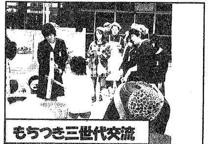
もちつき三世代交流