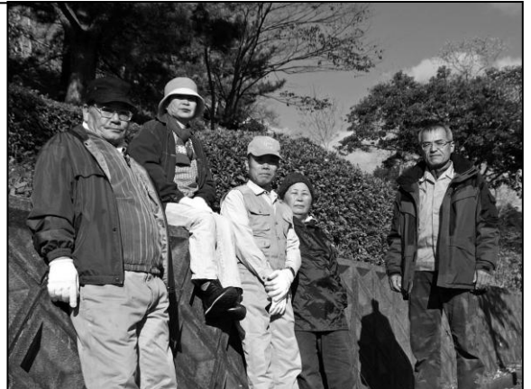
地区のために懸命に取り組まれた皆さん (7人の中の一部の方々)

秋月二丁目自治会と扇町県住自治会は、秋月公園始まって以来の、大規模な樹木伐採および公園美化活動を地区住民の手で取り組みました。