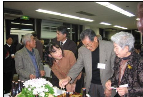
新春ふれあいの集い【今年もよろしく】