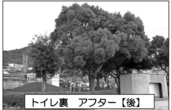
トイレ裏 アフター【後】