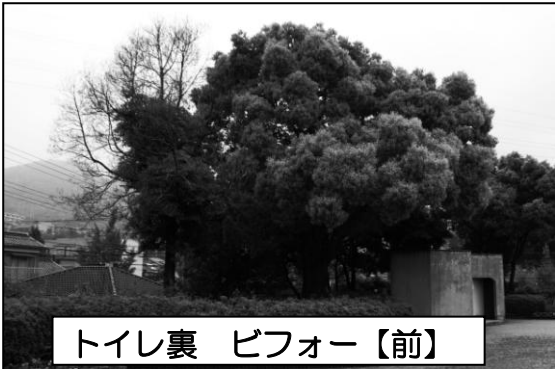
トイレ裏 ビフォー【前】