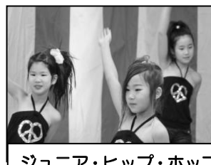
ジュニア・ヒップ・ホップ