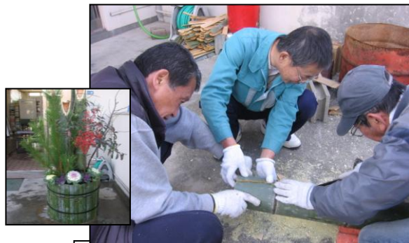
団塊生き方塾【初めての門松づくり】

この他、「いきいきサロン」「バドミントン大会」「子どもサマーキャンプ」「どんど焼き」等々、秋月地区の各諸団体で話し合い協力しあって、さまざまな活動を楽しみました。